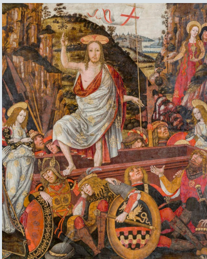
„Der Auferstandene Christus“ nach der Restaurierung (um 1500), Bistum Magdeburg, Dauerleihgabe im Kultur- historischen Museum Magdeburg