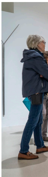
Abb. links und Titelseite : Generalversammlung des VCRK in Magdeburg 2023, Besuch des Kunstmuseums Magdeburg – Kloster unserer Lieben Frau

Die Bildbeispiele stammen aus den Beiträgen unterschiedlicher Autoren der Publikationsreihe des Vereins – „Alte und neue Kunst“ · 2022 + 2024